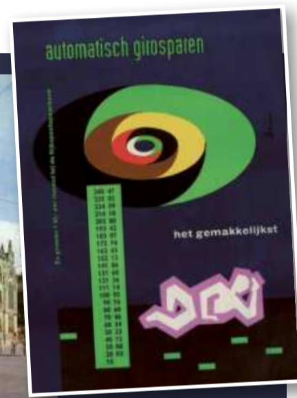
Affiche 'Automatisch girosparen', Rijkspostspaarbank, 1951. Ontwerp: Wim Brusse.

en parlementaire discussie gevoerd. De stemmen vóór een door de staat op te richten spaarbank werden steeds luider. In navolging van Engeland, waar sinds 1861 een 'Post Office Savings Bank' met succes gebruik maakte van de postkantoren, werd in 1880 in Nederland de instelling van een postspaarbank in het parlement behandeld. Het wetsontwerp voor de instelling van een rijkspostspaarbank werd in 1880 in het Nederlandse parlement aangenomen,