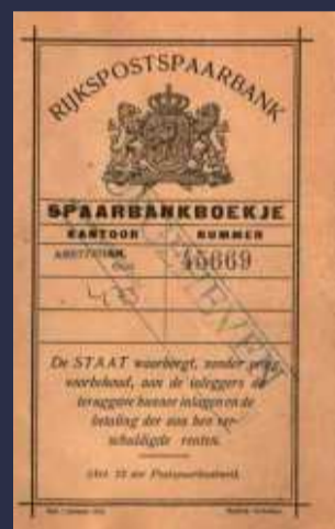
Schoolspaarkaart (met postzegels van 1 cent), Rijkspostspaarbank, Hulst, 1886.

zakelijk voor de Rijkspostspaarbank om te gaan samenwerken met de Postcheque- en Girodienst. Met automatisering, een meer marktconforme rentevergoeding en commerciële samenwerking als Postgiro/Rijkspostspaarbank, weten de Rijkspostspaarbank en Postgiro hun populariteit en bestaansrecht als de makkelijke en goedkope "thuisbank" voort te zetten. Als financiële overheidsinstellingen leidden het gebrek aan slagkracht en concurrerende mogelijkheden op de zakelijke markten uiteindelijk