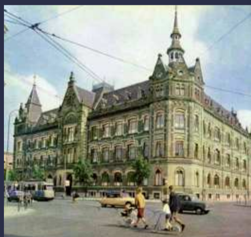
Hoofdkantoor Rijkspostspaarbank, Van Baerlestraat, Amsterdam, ca. 1965.