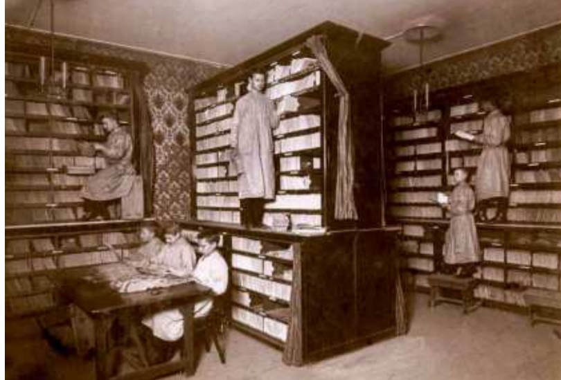
Middenlokaal Afdeling Rekening Courant van de Rijkspostspaarbank, ca. 1898.

Dit jaar is het 140 jaar geleden dat de Rijkspostspaarbank werd opgericht. Een 'non profit', nutsinstelling ter bevordering van het sparen in Nederland, vanaf 1 april 1881 operationeel in Amsterdam en feitelijk de oudste rechtsvoorganger van de huidige ING.